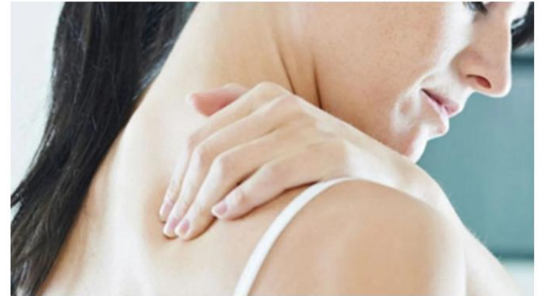
▲Dolor de cuello

El coste empresarial oscila entre los 1.258 y los 13.000 euros